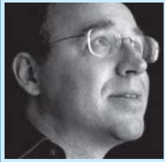
Proj. Arquitetônico: Itamar Berezin